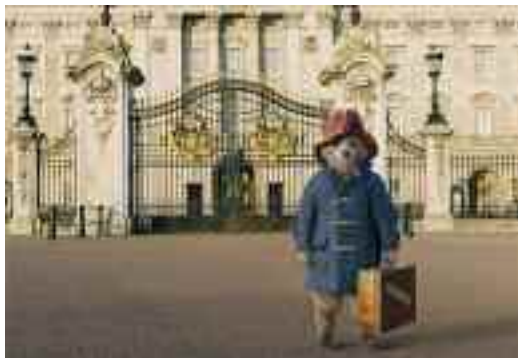
Paddington entdeckt London