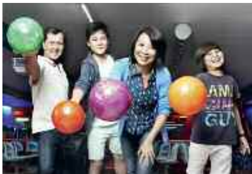
Einen Volltreffer landen

FAMILIENPASS/FAMILIENPASSPLUS Bowling 30.– statt 48.– pro Std./Familie, inkl. Schuhmiete