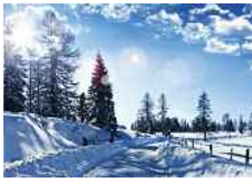
Erholung in freier Natur

FAMILIENPASSPLUS Familien können die Angebote von Kovive gemäss den detaillierten Bedingungen in den Broschüren in Anspruch nehmen.