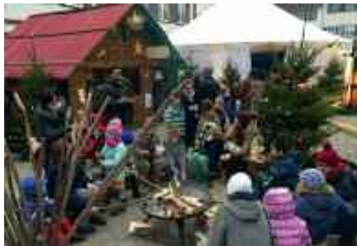
Im Märchen- wald verweilen

10% Rabatt auf Märchentaler für Werkangebote