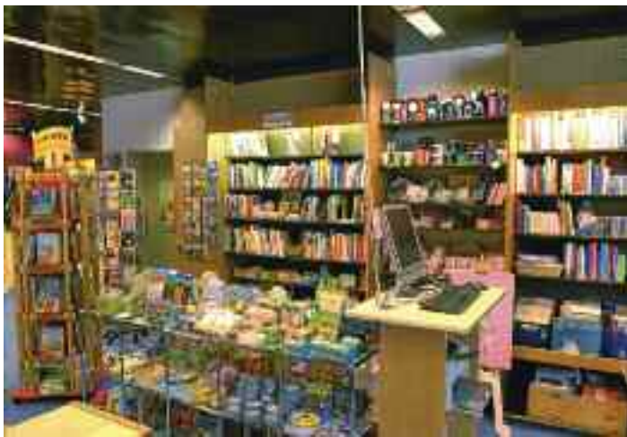
Ein Paradies für junge Leseratten

10% Rabatt auf alle CDs, Vergünstigung nicht kumulierbar mit anderen Rabatten