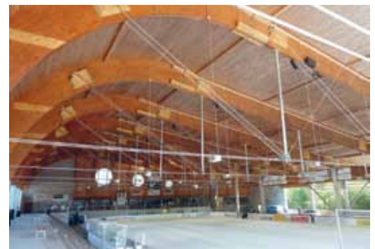
Kunsteisbahn Sissach: Treffpunkt für Jung und Alt

2 Bons. Jeder Bon berechtigt zum Grateintritt für die ganze Familie in eine der oben genannten Anlagen (Schlittschuhmiete inbegriffen).