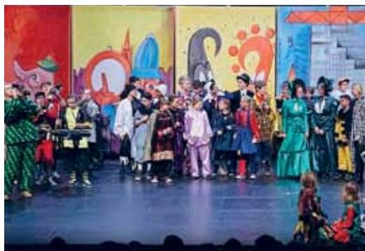
Vorfriede auf die Basler Fasnacht

FAMILIENPASS/FAMILIENPASSPLUS 12.– statt 15.– p.P. (solange Vorrat)