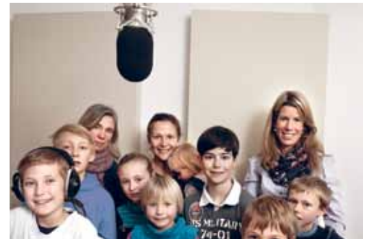
Radio Basilisk «SO TÖNT S LÄBE»