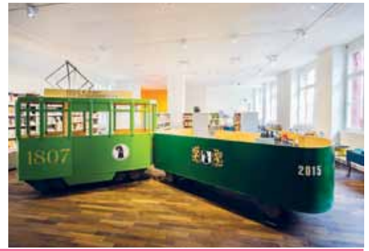
Die GGG Stadtbibliothek Basel im neuen Kleid

FAMILIENPASSPLUS Einwohner Kanton Basel-Stadt, Allschwil, Schönenbuch und Pratteln: Jahresabo 20.– statt 40.– Einwohner restliche Gemeinden der Nordwestschweiz: Jahresabo 30.– statt 55.–