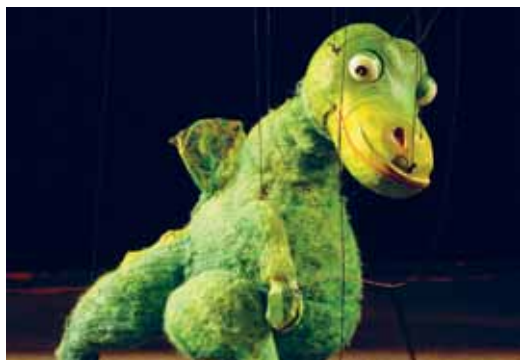
Urmel – geliebter Dinosaurier

FAMILIENPASS/FAMILIENPASSPLUS Erwachsene 16.– statt 19.– Kinder 14.– statt 17.–