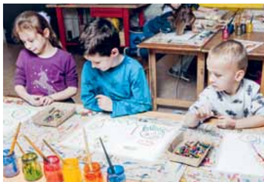
Forum Würth Arlesheim

FAMILIENPASS/FAMILIENPASSPLUS 190.– statt 200.– pro Gruppe, inkl. Material, Kuchen und Getränken