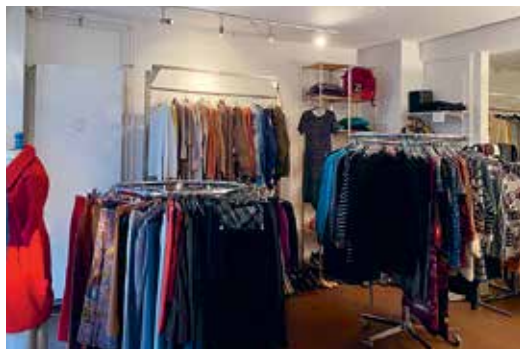
Schweizerisches Rotes Kreuz Basel