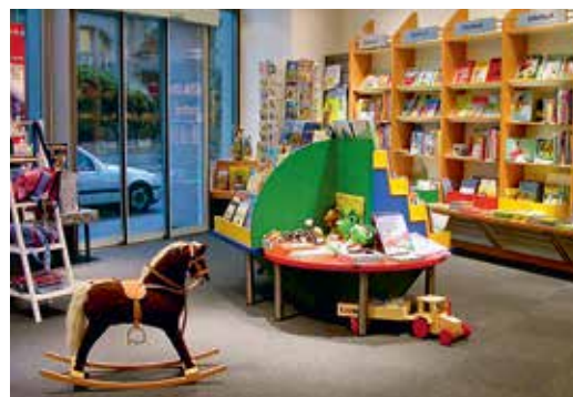
Bider & Tanner

10% Rabatt auf das gesamte Sortiment der Kinder- und Jugendbuchabteilung. Vergünstigung nicht kumulierbar mit anderen Rabatten